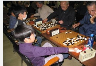
～外部団体戦の一コマ～