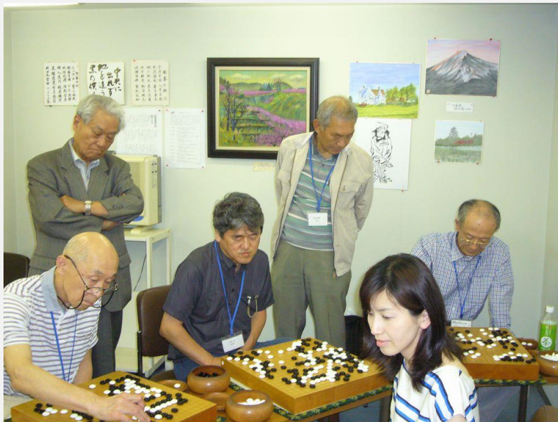
～懇親碁会 青葉かおり棋士の指導碁～